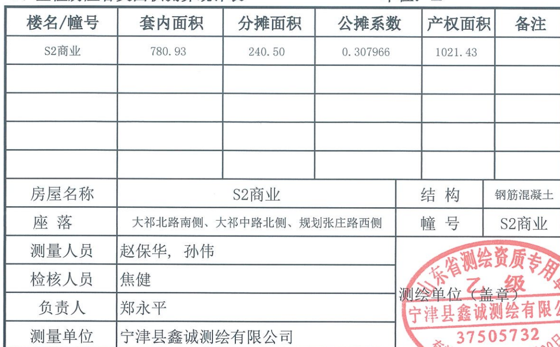
2、各幢房屋内分层、分户各类面积测算统计表