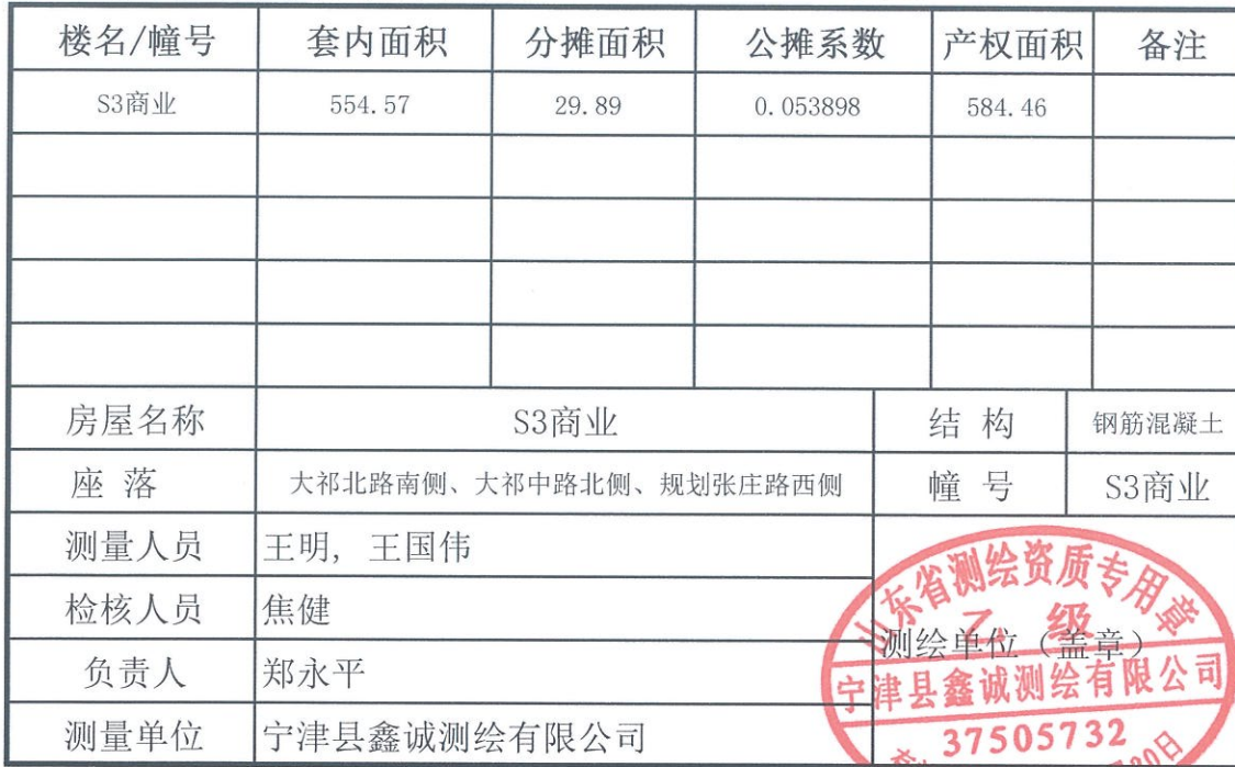
2、各幢房屋内分层、分户各类面积测算统计表