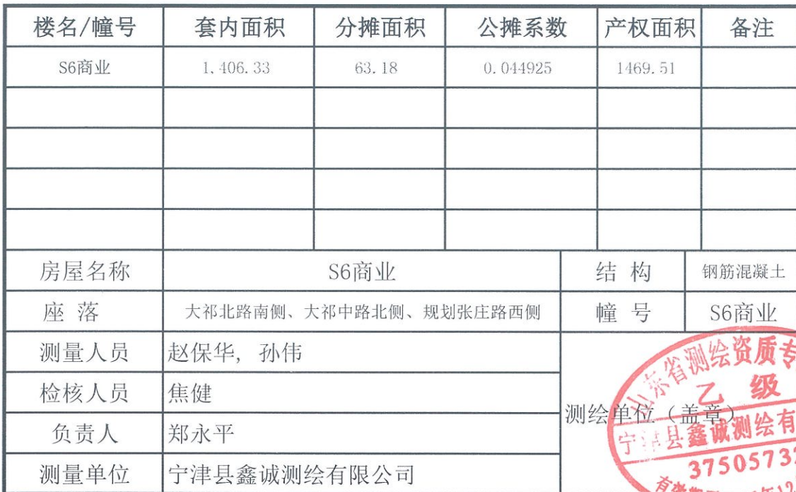
2、各幢房屋内分层、分户各类面积测算统计表